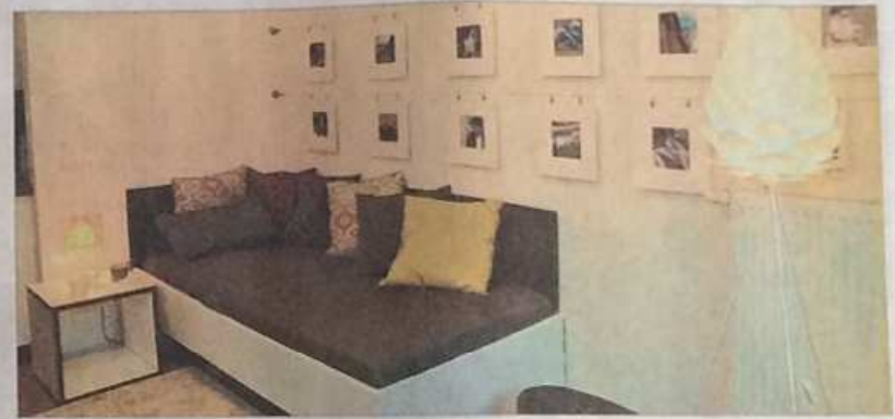
Eine Musterwohnung zeigt, wie das Wohnen im City Campus Siegen aussehen kann. Die Appartements sind komplett möbliert.